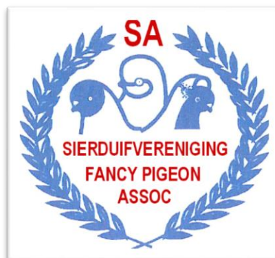
UK Bied SA's Aan