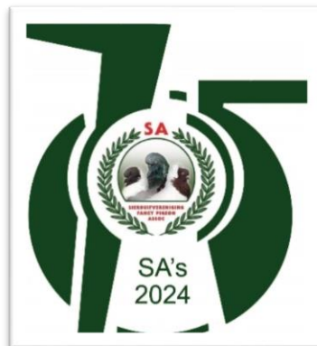
75ste Kampioenskapskou Embleem