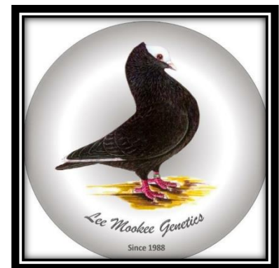
Borg van Duiwe Kos